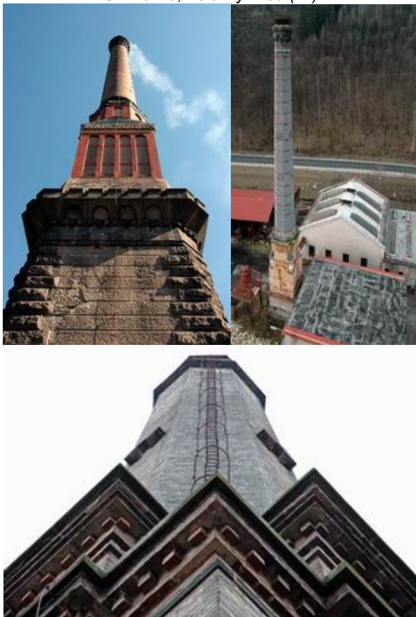
Smržovka, Železný Brod (2x)

Na seznamu kulturních památek je textilka firmy Feigl & Widrich v Chrastavě. Komín není ani tak krásný a tak starý jako výše zmíněné, avšak přímo navazuje svým oktagonálním podstavcem na unikátně vyvedenou secesní kotelnu a společně tak tvoří jeden ladný celek. Kotelna je postavena z režného zdiva a je propracována do takových detailů, že plně může konkurovat nejhonosnějším sídlům své doby. Komín z roku 1905 je 60 metrů vysoký a má dřík kruhového profilu, je vyzděn ze žlutých radiálních cihel a zakončen je dvojitou římsou, na kterou navazuje ozdobná hlava s mozaikou z černých cihel. Komín i kotelna jsou již nefunkční, v plánu je konverze objektu, komín bude zachován.