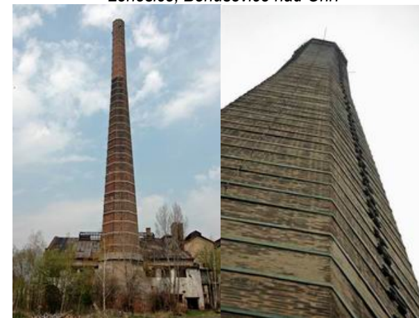
Lenešice, Bohušovice nad Ohří

Dosud funkční je cukrovar v Dobručicích. V jeho areálu se nachází 65ti metrový komín s reservoárem na vodu (z cca desátých let 20. století) a 57 metrový oktagonální